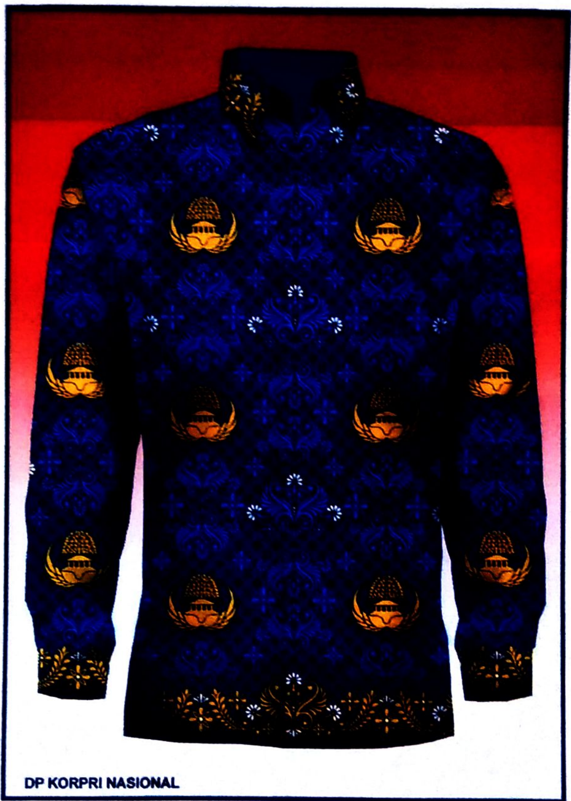
DP Korpri Nasional